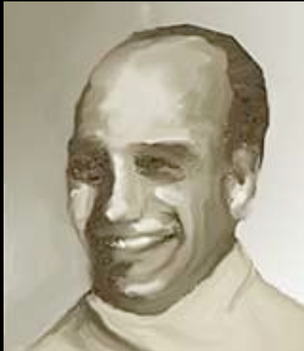
Introduction to Kinesics, 1952 Kinesic and Context